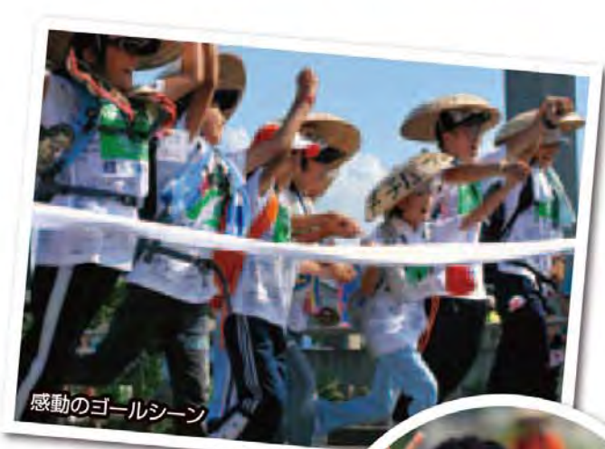
感動のゴールシーン

スタートの時は完歩できるか心配でした。お母さんとはなれてから、完歩できなかつたらどうしよう？と不安になりました。だけど友だちとお話しながら歩いていると不安なんてなくなりました。班の人たちとご飯を食べたり、一緒にねたりにきて楽しかったです。だけどやっぱり最後の弥彦山登山はつらかったです。登山の最後のほうが最初より楽しく、らくにのほれました。それも、大鳥居でゴールしたら、涙が出てきました。来年も100km徒歩の旅に参加しようと思います。